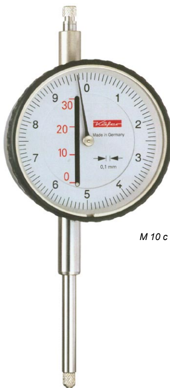
M 10 c